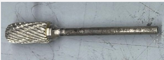
FOTO DELLE FRESE